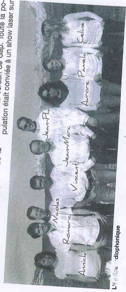
La radio d'ici

L'ouverture des ondes s'est effectuée le jeudi 23 février à 19h30 en direct depuis la place de Verdun de Gap. Toute la population était conviée à un show laser sur